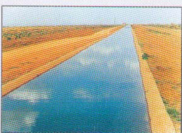
Alimentação de Canais para Pivô Central