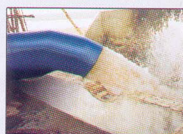
Alimentação de Tanques para Criação de Camarões

A variação do nível da água não interfere no funcionamento do equipamento.