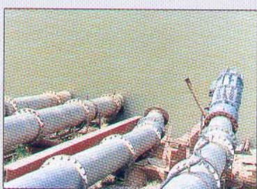
Irrigação de Lavouras de Arroz